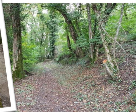
Nettoyage du "chemin du Grand Clos" entre la route de la colonie et Faucigny