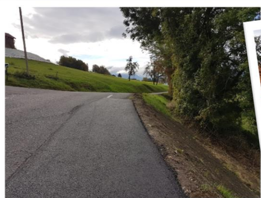
Renforcement du talus afin de sécuriser la route de Lossiège