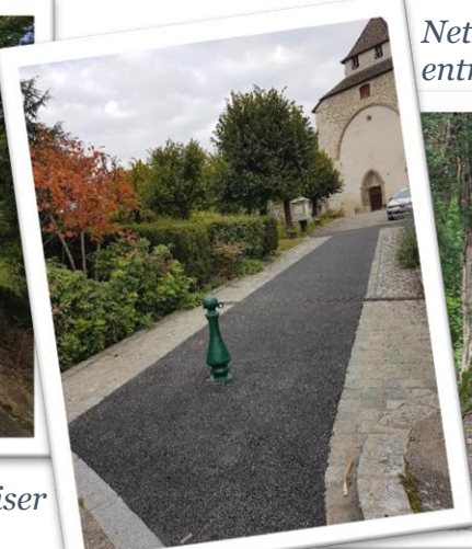
Enrobé sortie de l'église